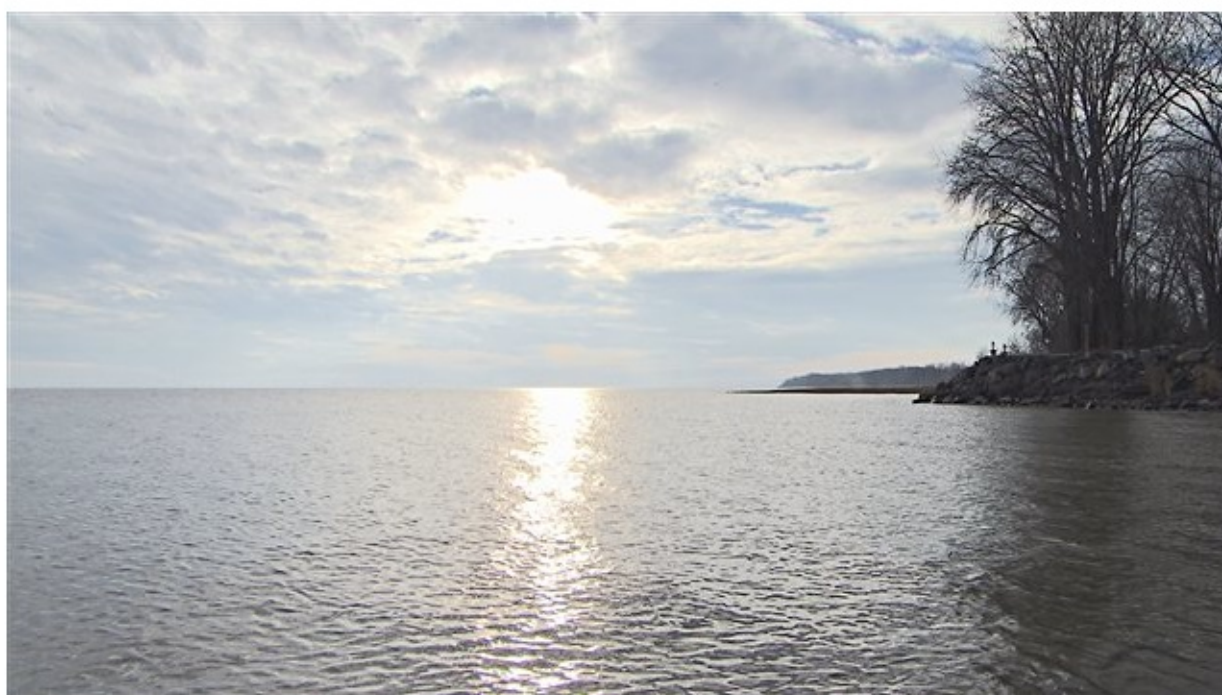
Le Lac Saint-Pierre.

En fin de journée, mercredi, les municipalités riveraines de la Mauricie et du Centre-du-Québec attendaient avec appréhension l'arrivée du panache d'eaux usées de Montréal. Elles craignent d'éventuelles conséquences sur l'environnement. Depuis minuit une minute, mercredi, Montréal procède au déversement de ses eaux usées dans le fleuve Saint-Laurent.