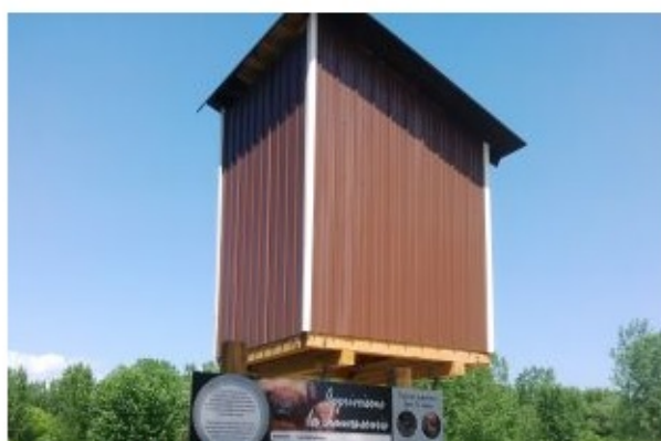
«On doit compenser la perte d'habitats naturels pour les chauves-souris»

Un appui financier de 18 225$ provenant de la Fondation Hydro-Québec pour l'environnement et l'investissement d'un montant de 5 500$ provenant du Comité ZIP ont permis d'installer des nichoirs et une maternité pour les chauves-souris.