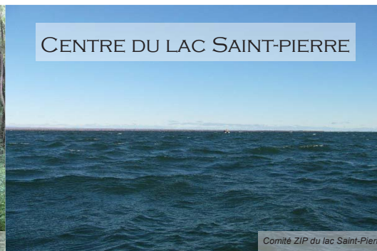
Comité ZIP du lac Saint-Pierre