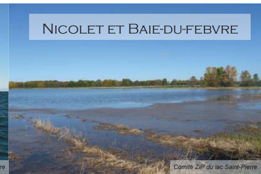
Comité ZIP du lac Saint-Pierre

L'enchevêtrement de différents habitats tels que : la plaine inondable, le fleuve Saint-Laurent, les cours d'eau agricoles et les marais offrent des écosystèmes précieux pour la faune aviaire.