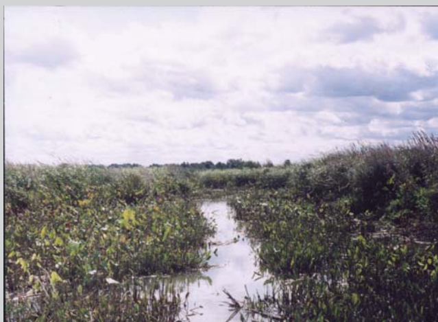
Le chenal de la baie Millette