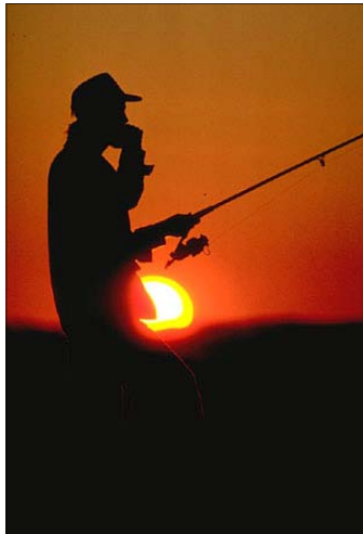
L'aire faunique communautaire, un moyen efficace d'augmenter la qualité de la pêche sportive

L'AFC implique l'imposition de droits d'accès qui permettront de financer des aménagements, des ensemencements et l'embauche d'assistants à la conservation de la faune dans le but d'accentuer la surveillance anti-braconnage.