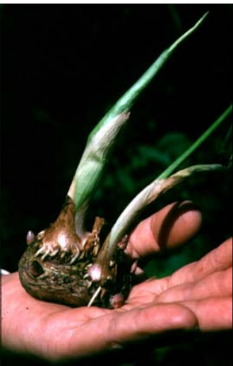
Corme d'arisème dragon ( Arisaema dracontium )

dragon a fait l'objet de reportages aux émissions La semaine verte et D'un soleil à l'autre , diffusées sur les ondes de Radio-Canada.