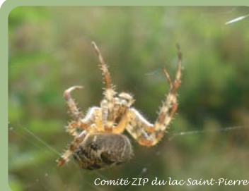
Comité ZIP du lac Saint-Pierre

La différence? Les araignées ont huit pattes, pas d'ailes, pas d'antenne et leur corps est en deux parties.