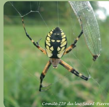
Comité ZIP du lac Saint-Pierre