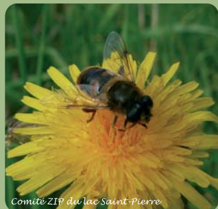
Comité ZIP du lac Saint-Pierre