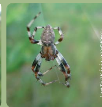
Comité ZIP du lac Saint-Pierre