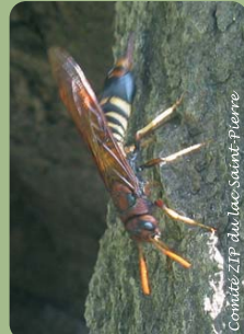
Comité ZIP du lac Saint-Pierre