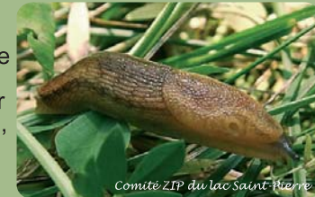
Comité ZIP du lac Saint-Pierre

Les gastéropodes font partie de l'embranchement des mollusques, caractérisés par une carapace à une valve, une tête avec des yeux et une langue munie de dents.