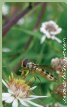
Comité ZIP du lac Saint-Pierre