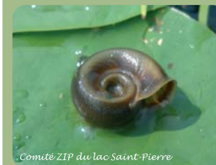
Comité ZIP du lac Saint-Pierre