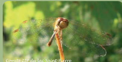
Comité ZIP du lac Saint-Pierre