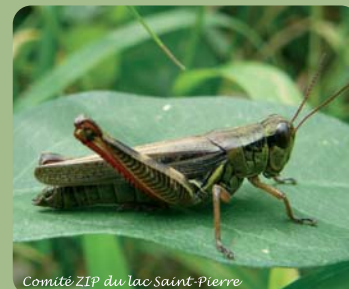
Comité ZIP du lac Saint-Pierre